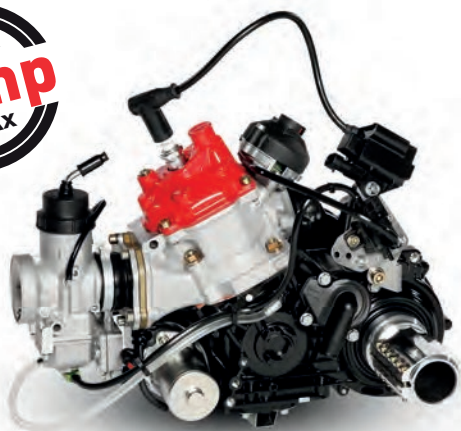
KIT DE MOTOR Y MOTOR SOLO